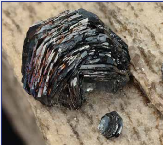
EMATITE: cristalli fino a 14 mm. Monte Cervandone, Val Devero, Piemonte. Coll. A. ed E. Sartori.