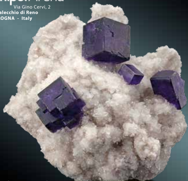
Fluorite, cristalli fino a 1,6 cm. Miniera di Zogno Val Brembana, Bergamo. Coll. Marsetti.

Via Gino Cervi, 2 Casalecchio di Reno BOLOGNA - Italy