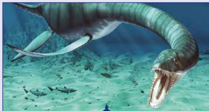
Lo Zarafasaura oceanis sarà esposto nella mostra "Abissi Estinti" da The Brothers Stones