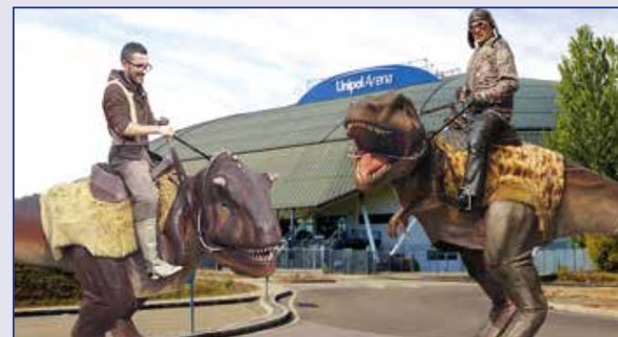
Il baby T-Rex e il Carnosaurus ; un'attrazione ormai consolidata al Bologna Mineral Show.