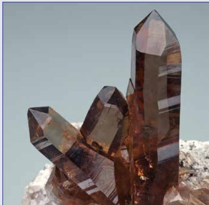
QUARZO: cristalli fino a 5 cm. Monte Cervandone, Val Devero, Piemonte. Coll. A. ed E. Sartori, foto R. Appiani.

Prosegue anche questo filone tematico iniziato già da qualche anno, dove i più importanti Musei italiani propongono in esposizione una selezione di alcune tra le più significative meteoriti conservate nelle loro collezioni.