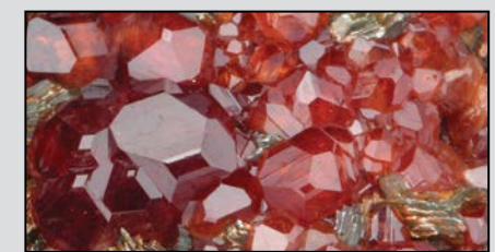
Minerali della Liguria: GROSSULARIA . Minerali della Liguria: CRISOCOLLA .