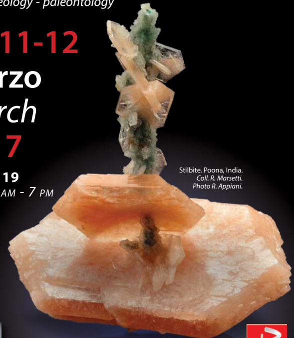
Stibite, Poona, India. Coll. R. Marsetti.