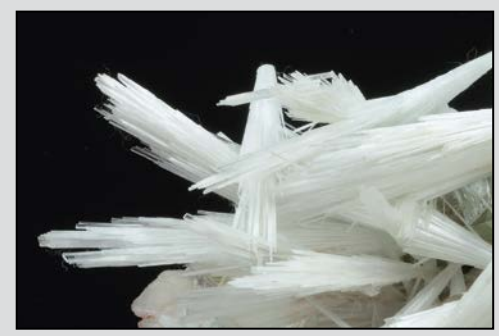
Minerali di Pune, India: SCOLECITE . Minerali della Liguria: TITANITE .

Bologna Mineral Show and Bijoux Expo . Two events, well separated but at the price of one, for a double result of public and exhibitors.