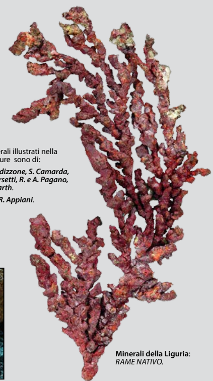
I minerali illustrati nella brochure sono di: G. Baldizzone, S. Camarda, R. Marsetti, R. e A. Pagano, I. Seifarth.

The Bologna Mineral Show has reached the 48 th edition and is confirmed as the mineralogical event more expected in Italy and one of the most important in Europe. For the 2017 edition, the Bologna Mineral Show continues to apply the formula that won so much appreciation last year both for the high level of business and cultural aspects and for the quality of the services offered. Particularly rich is the offer of the best minerals and fossils from all over the world displayed by top collectors and dealers.