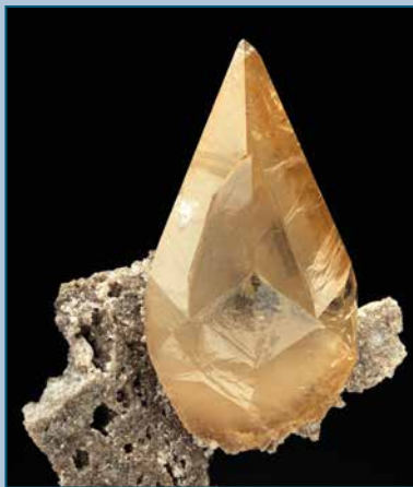
Calcite: 5,2 cm. Elmwood Mine, Tennessee. Coll. L. Gal. Calcite: 5,2 cm. Elmwood Mine, Tennessee. Coll. L. Gal.