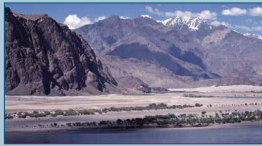
Shigar Valley, Pakistan. Paradiso per i cristalli. Shigar Valley, Pakistan. A paradise for crystals.