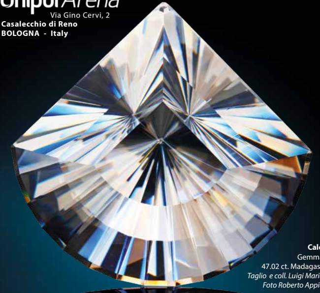
Calcite Gemma di 47.02 ct. Madagascar. Taglio e coll. Luigi Mariani.

Unipol Arena Via Gino Cervi, 2 Casalecchio di Reno BOLOGNA - Italy