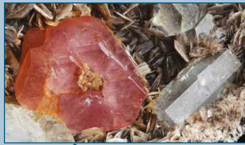
"Apatite" con acquamarina, Shigar Valley, Pakistan. Coll. L. Piasco. "Apatite" with aquamarine, Shigar Valley, Pakistan. Coll. L. Piasco.