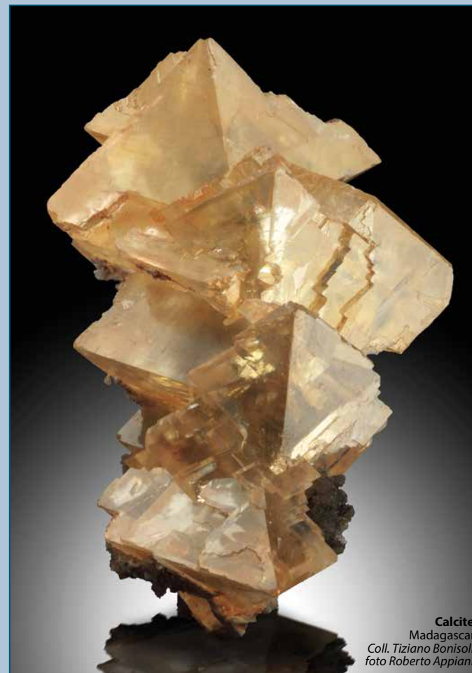
Calcite. Madagascar. Coll. Tiziano Bonisoli.

Calcite is not only one of the most common minerals in nature, but also among the most appreciated collectibles for the beauty and variety of its crystals. Calcite is not just beauty: the history of mineralogy is closely linked to the study of this mineral and its properties, starting from the first intuitions of Haüy on the structure of the crystals, ending with its peculiar optical properties, including birefringence, widely exploited in the creation of microscopes from mineralogy and beyond. At the 51st Bologna Mineral Show will be proposed an extensive review of samples of calcite from all over the world, together with an educational path that will illustrate its properties.